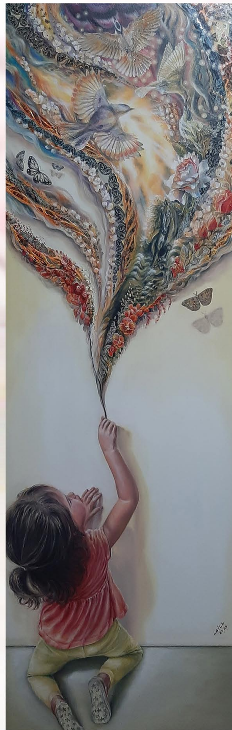
"Ella". Técnica mixta. Laila De Sousa