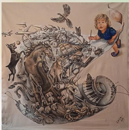
"Qué haces!!!". Acrílico sobre lona. Laila De Sousa