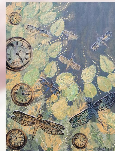
Técnica mixta. Susi Verdú