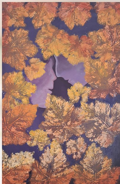
"Dos caminos". Óleo sobre lienzo. Susi Verdú