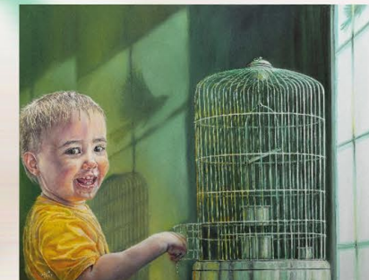
"Ya se fue". Óleo sobre lienzo. Laila De Sousa