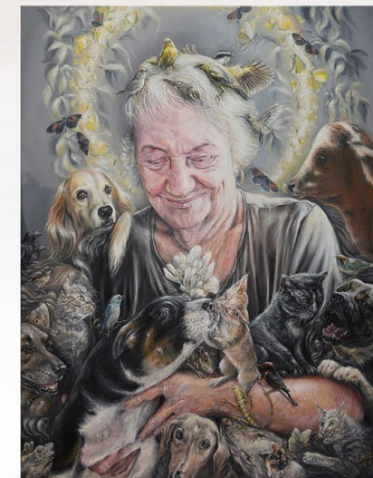
"Frenesi". Óleo sobre lienzo. Laila De Sousa