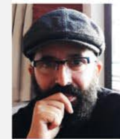
Diego Alexandre Asi

Nació en 1947 en Tala, Uruguay. Un artista de gran trayectoria internacional. Su arte convoca en el contemplador la necesidad de interpretaciones que va más allá de lo sensible en la madura plástica de Febles Ceriani. Reside la frescura que transmiten sus obras, cargadas de color, de aciertos plásticos que invitan a perderse en los recovecos de una grácil e infinita geometría laberíntica.