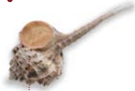
• caragol punxós