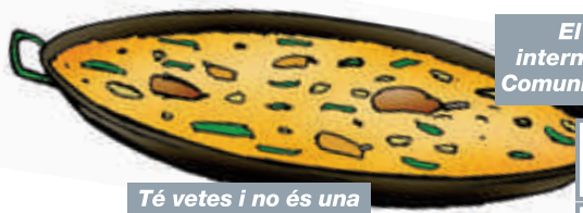
El plat més internacional de la Comunitat Valenciana

Té vetes i no és una mina. El de bellotes és cosa fina