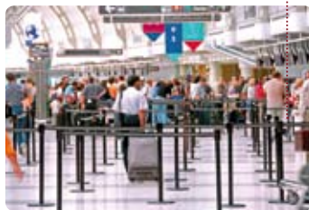
despatx de facturació