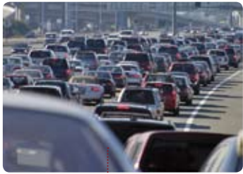
• operació eixida