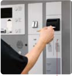
• expenedor de bitllets